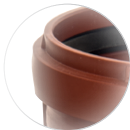
Надежный уплотнительный валик