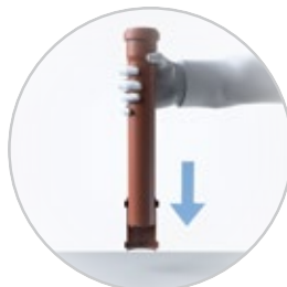
Преобразование муфты в ремонтную путём выталкивания упоров