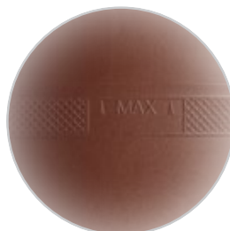
Отметка глубины вставки трубы