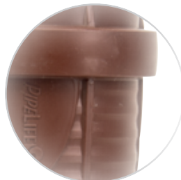
Сборочное приспособление – маркировка угла